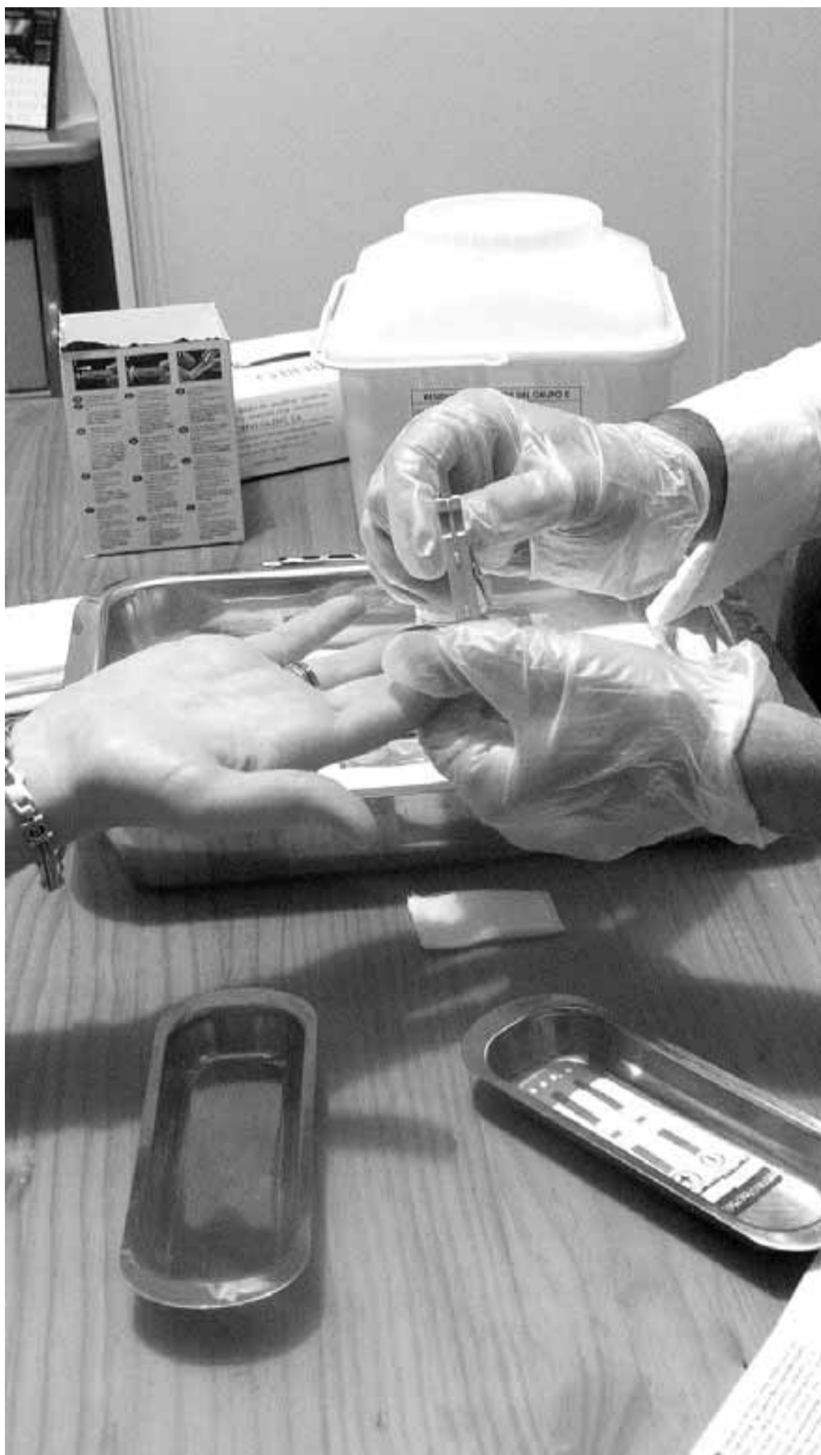
Un joven se realiza una prueba rápida para saber si ha contraído el virus del sida.

● Nuevos casos en Euskadi. En 2008, lo que refleja un aumento con respecto a los 173 casos de 2007.