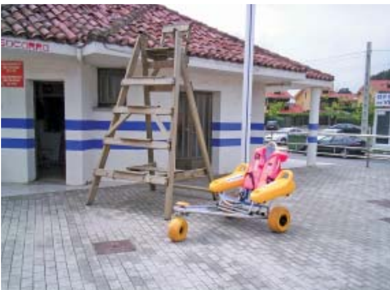
■ Instalaciones adaptadas en la Playa de Santa Marina.

Específicamente se propone el diseño de un circuito llamado Paraísos Marinos; Patrimonio, Bienestar y Naturaleza. Esta ruta une los recursos culturales de las casas de los indios con los recursos naturales de la Playa de Ribadesella y el Parque Natural del Malecón. La trayectoria comienza en el Puente, sigue por la Calle Coronel Bravo, continúa por la Playa Santa Marina, entra por el Parque Natural del Malecón, vuelve por el núcleo actual y termina en el punto de partida.