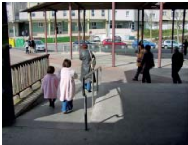
■ Accesos a la estación de autobuses.