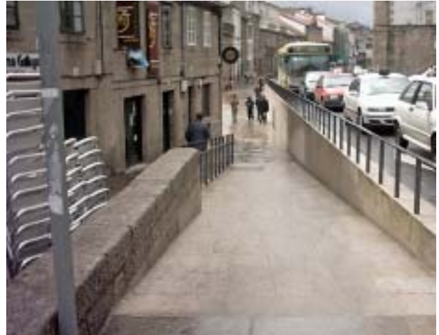
■ Accesos a la Iglesia de Carme de Abaixo y Praza do Matadoiro.

Primera toma de contacto con la Asociación de Minusválidos Físicos de Santiago, planteamiento de su problemática concreta e inicio del trabajo con-