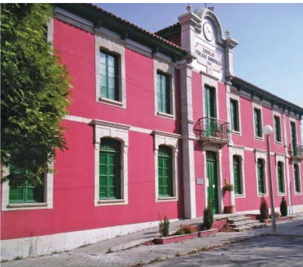
■ Fachada del Museo del Carmen.

Se trata, sin duda, de un edificio singular que destaca una posición destacada dentro de la llamada arquitectura indiana de Ribadesella.