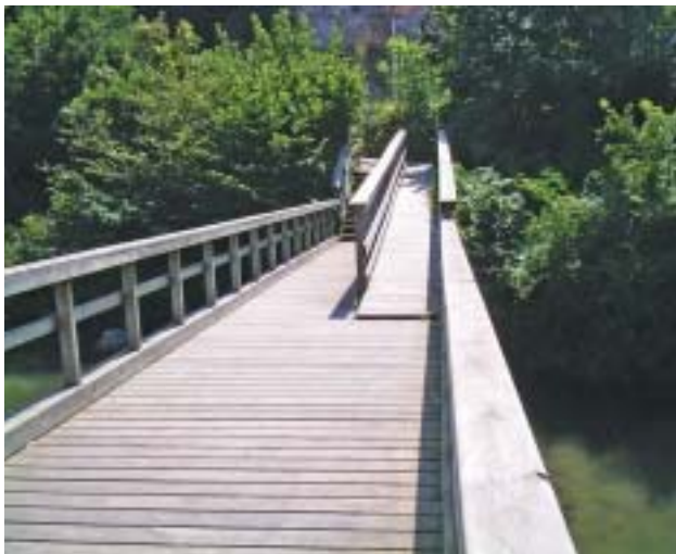
■ Parque del Malecón.