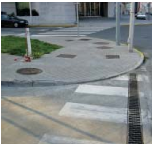
■ Rúa Loureiros y Barrio Paxonal.

Las decisiones planificadoras adoptadas desde finales de los años 80, concretamente en el año 1989 a través de su Plan Xeral de Ordenación Urbana, planteado como crecimiento lineal y evitando el crecimiento concéntrico, en lo que se ha bautizado como el Modelo Atlántico, referente de las ciudades y villas gallegas, aunando tradición y modernidad desde una posición disciplinar de proyecto blando y reversible, nos ha aportado parámetros importantísimos para enriquecer el debate de proyectos y la toma de decisiones.