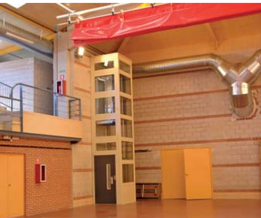
■ Adaptaciones en el Polideportivo de Fontanar.

El Servicio de Ayuda a Domicilio tiene por objeto prevenir y atender situaciones de necesidad prestando apoyo de carácter doméstico, psicológico y