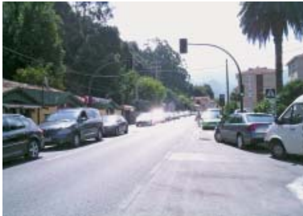
■ Actuaciones en el viario.

A finales del año 2002, las escuelas fueron destinadas a albergar el Museo Territorio de Ribadesella, por lo que se hizo necesario dotar al edificio de unas instalaciones adecuadas que facilitaran lo máximo posible el acceso a todas las personas en general y específicamente para aquellos colectivos con problemas de movilidad.