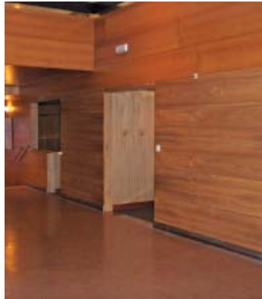
■ Accesos al Auditorio de Galicia.

trabajo quedó brillantemente plasmado en la Guía de Accesibilidad editada por el Ayuntamiento.