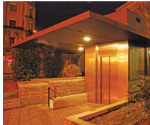
■ Inauguración de ascensor y acceso a aparcamiento público.

Muestra de Teatro Especial de Galicia para dar a conocer al público la labor realizada en el teatro por personas con discapacidad.