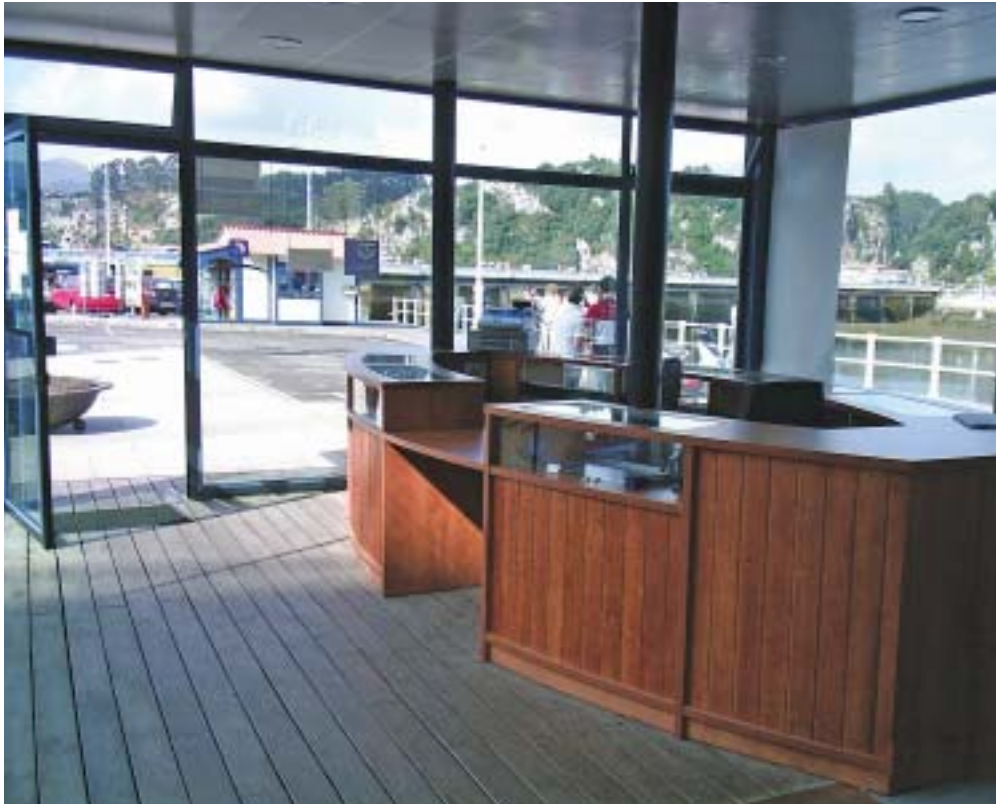
■ Oficina de Turismo.