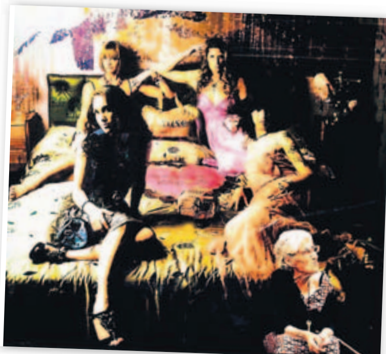
'BILBAO MODA'. La anciana es conocida en Pozas.

Opina que Bilbao «no es difícil de fotografiar», pero la «mayoría» de la gente sólo retrata el centro, por lo que hay muchas zonas todavía vírgenes para el objetivo fotográfico. Aunque el problema, cual ley de Murphy, es que «siempre que ves algo, casi nunca llevas cámara». Premisa en la que coincide Diego Jambrina, que se ha compra-