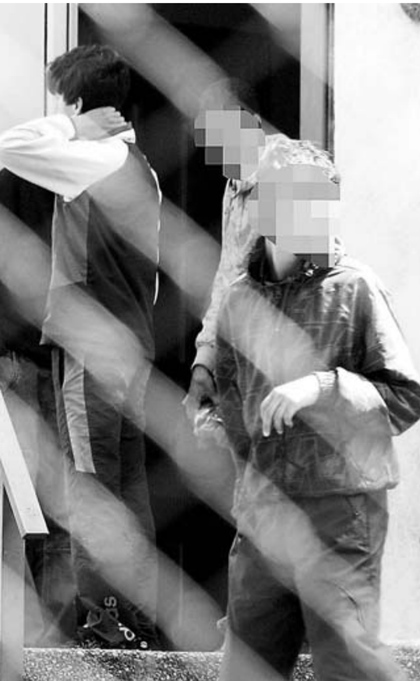
delito son reincidentes.

personas de edades comprendidas entre 14 y 18 años. Y la tasa de delincuencia juvenil en este ámbito poblacional es muy escasa», señaló el viceconsejero. Fínez manifestó que no existe dato alguno que corrobore que se haya producido un crecimiento de la delincuencia, salvo estos hechos puntuales que estamos preocupados por atajar».