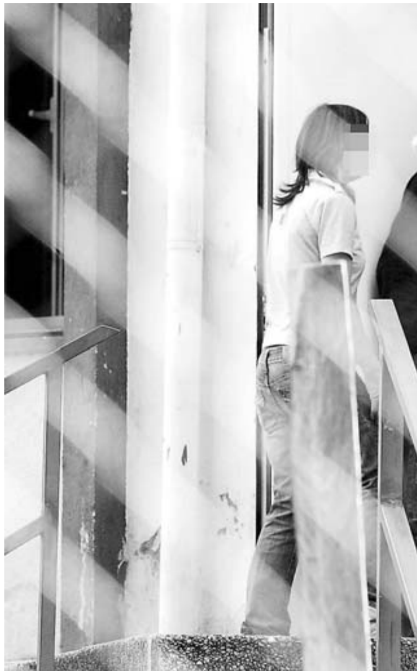
INFRACTORES. Sólo el 13% de los menores que han cometido algún

por los mismos autores, esta vez sobre una muestra de 500 menores que nunca habían delinquido, concluye que la tasa de reincidencia fue del 18,5%. «Por lo tanto, es importante señalar que la medida que el juez impone a un menor que comete su primer hecho delictivo tiene un impacto positivo, puesto que cerca del 80% no vuel-