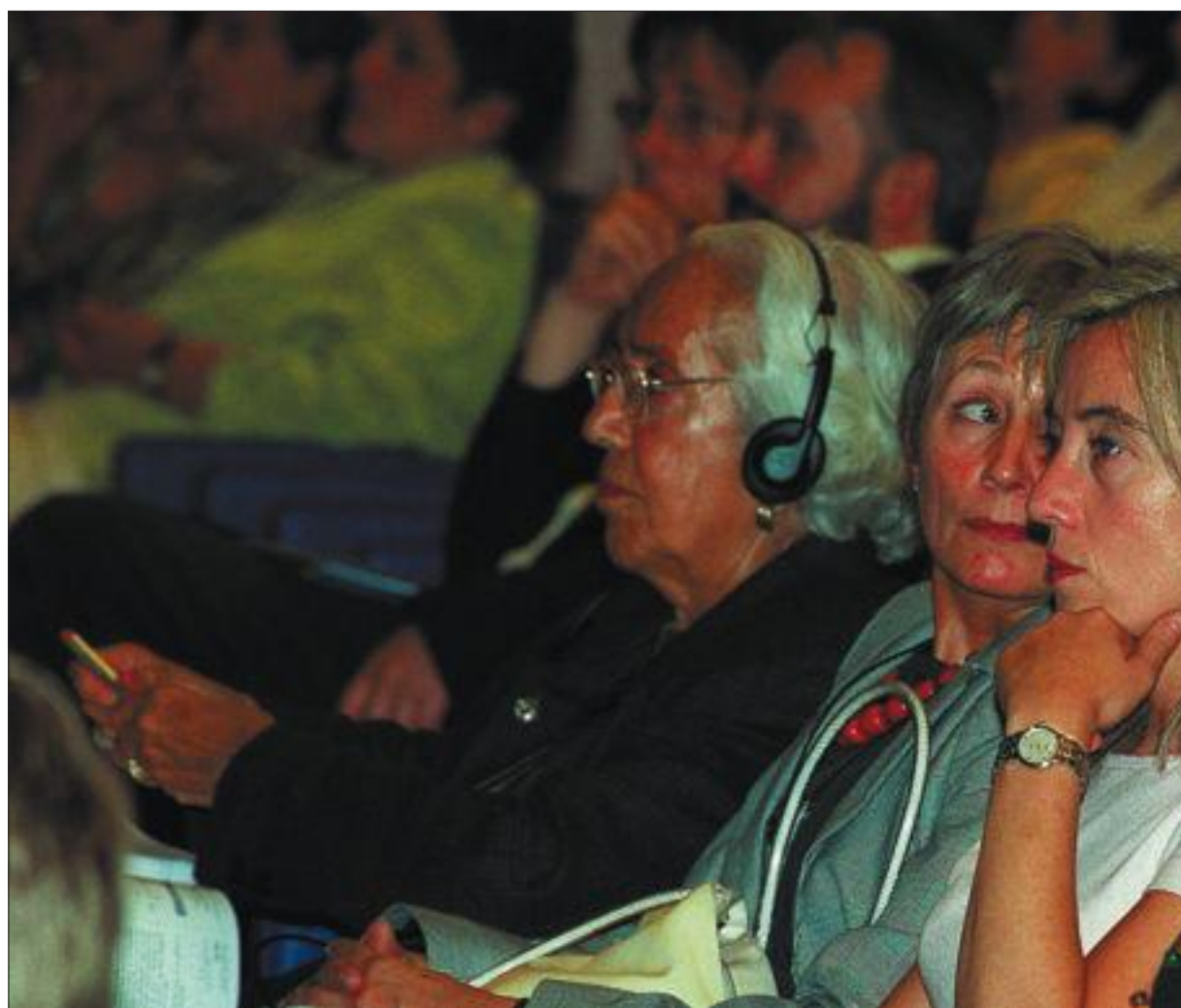
Participantes en un congreso de mujeres empresarias celebrado en Bilbao.