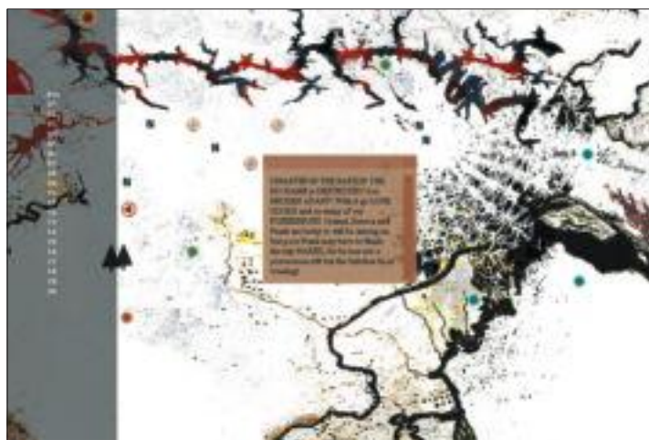
Los diarios de viaje de John Wesley Powell durante la primera expedición al río Colorado, en 1869, son el punto de partida de Voyage into the unknown .

Tal como ocurrió en 1930, durante este mes de julio una versión digital del Mahatma Gandhi recorrió el mundo virtual de Second Life llamando la atención sobre los problemas del subcontinente indio. El avatar de Gandhi es controlado a través de un cinta transportadora ( tapis roulant ) instalado en las salas del Eyebeam y