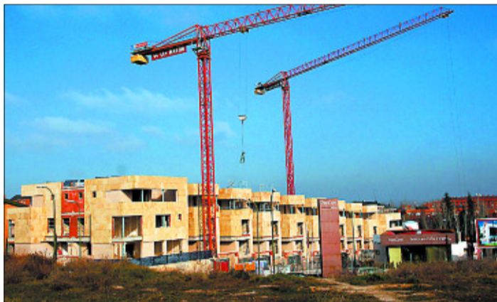
Los visados de obra nueva caen algo más del 30% en Madrid.

endeudamiento de las familias es a 20 y 25 años, mientras que a comienzo de los noventa era a 15 años. "El compromiso a largo plazo agrava la incertidumbre si se suma la precariedad laboral", según Barta. El alto endeudamiento dificulta también la capacidad de reacción a particulares y promotoras, que fijaban su inversión a seis o siete años y que se enfrentan a caídas en las ventas que, a su juicio, supera el 50% que se ha apuntado para rozar el 90%. Y tendrán que bajar más los precios.