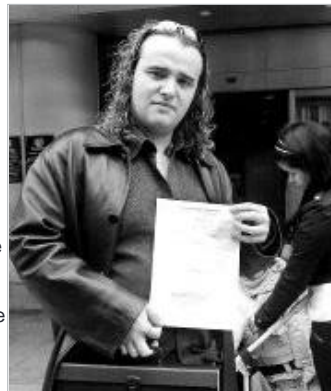
El padre de la niña, tras interponer el recurso.

El colegio donde estudiará la niña colombiana tiene 6 inmigrantes de un total de 55