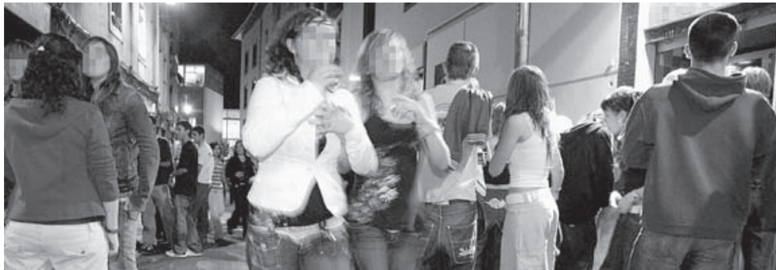
CON LUPA. Dos jóvenes atraviesan una calle del Casco Medieval de Vitoria, atestada de menores, en busca de diversión.