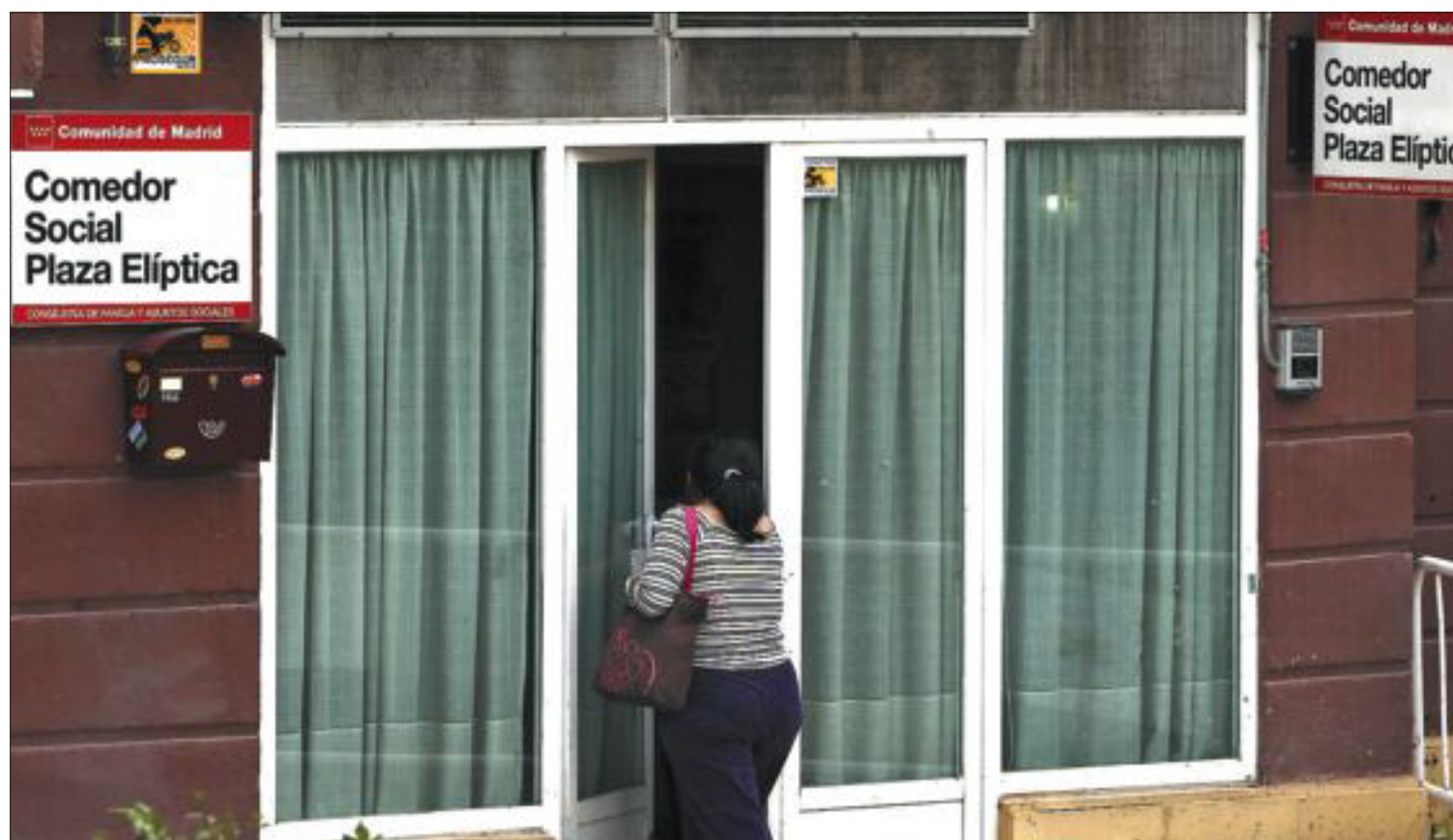
Una mujer acude a un comedor social de la comunidad en la plaza Elíptica.