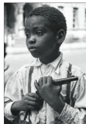
Una imagen de Helen Levitt.