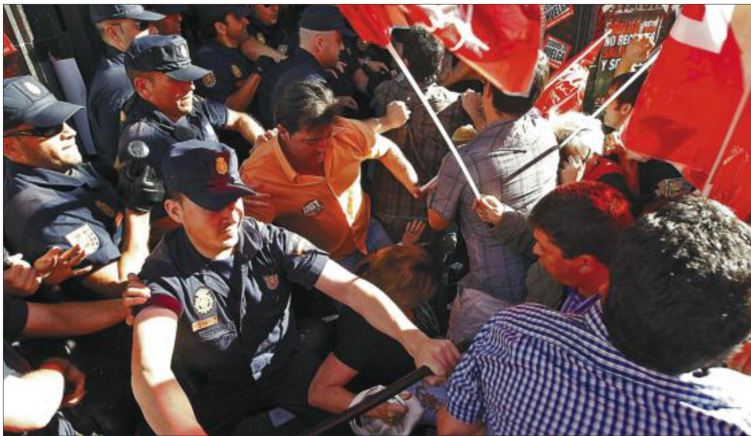
Incidentes entre policías y sindicalistas a la entrada del Área de Gobierno de Hacienda de Madrid.