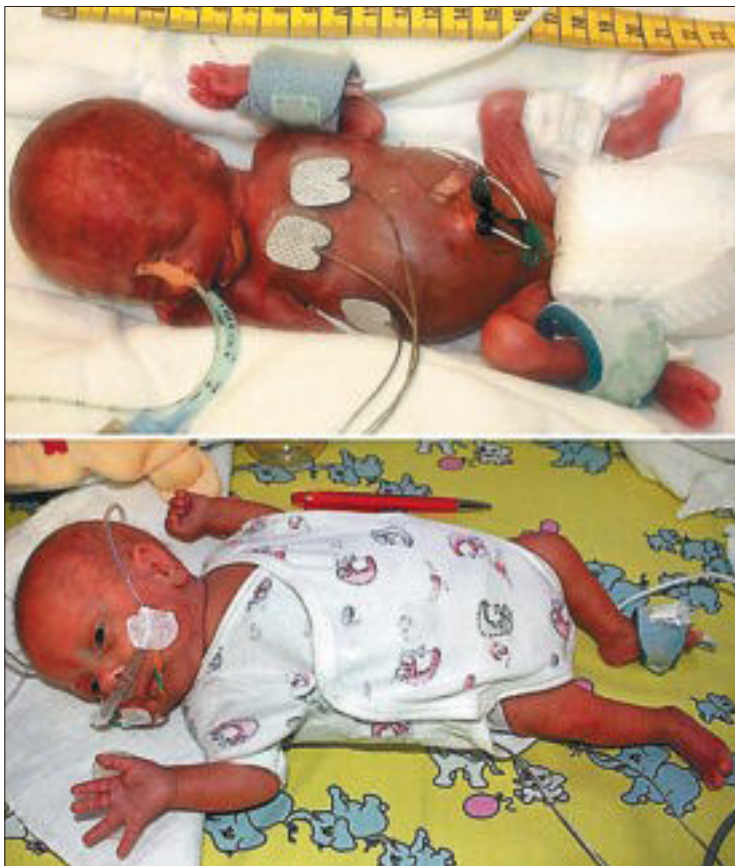
El bebé cuando nació en junio (arriba), y en octubre.

El caso es un nuevo avance en la neonatología. Los bebés prematuros tienen múltiples problemas (falta de madurez de los órganos, y también falta de equipos adaptados para los cuidados). Pero, en este caso, el niño se vio favorecido por el tiempo que llevaba de gestación. De los dos factores que influyen en la supervivencia de un recién nacido (tiempo de embarazo y tamaño), se ha demostrado que el que cuesta más rebajar es el primero. Los avances en microcirugía y en micromedicina en ge-