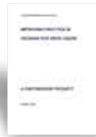
TÍTULO: IMPROVING PRACTICE IN HOUSING FOR DRUG USERS EDITA: HOME OFFICE AÑO DE PUBLICACIÓN: 2008

documento, que, a partir de la experiencia de Shelter, Homeless Link y otras entidades británicas con servicios especializados en vivienda, recoge una serie de consejos dirigidos a los profesionales de servicios residenciales y de vivienda para drogodependientes y ex drogodependientes. Se trata de recomendaciones que abordan todos los apoyos que puede precisar una persona drogodependiente para conseguir y mantener una vivienda, tales como, por ejemplo, el entrenamiento para llevar la economía doméstica y el aprendizaje de las tareas domésticas. Se incluyen también los apoyos en el sentido más amplio de la palabra, entre ellos, los relacionados con la recuperación de relaciones familiares perdidas y la ayuda para desarrollar habilidades útiles para la vida diaria. No obstante, señalan los autores, conviene tener en cuenta que las personas drogodependientes no forman un grupo homogéneo, por lo que es recomendable la colaboración entre los servicios de salud mental, los sociales, los de vivienda y los de justicia. De acuerdo con este documento, una buena coordinación entre los diferentes agentes implicados ayuda a crear soluciones individualizadas y flexibles, es decir, que permitan modificar la respuesta de acuerdo con las necesidades del usuario, que normalmente varían según la fase de recuperación en la que se encuentre.