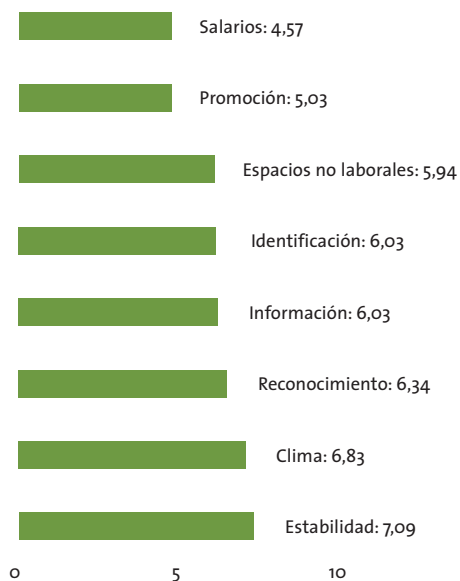
Gráfico 3. Media de satisfacción* en varias cuestiones entre trabajadores de CEE (en %)

*Nota: 0 Nada satisfecho, 10 totalmente satisfecho.