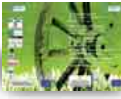
TÍTULO: GUÍA DE BUENAS PRÁCTICAS PARA LA INCLUSIÓN SOCIAL DEL PUEBLO GITANO EN EUROPA / EUROPAIN IJITO-HERRIA GIZARTERATZEKO JARDUNBIDE EGOKIEN GIDA EDITA: GENERALITAT DE CATALUNYA PÁGINAS: 77 AÑO DE PUBLICACIÓN: 2007

romaní, ni tampoco son frecuentes las referencias europeas a proyectos o programas dirigidos y desarrollados por este grupo étnico. Esta guía de buenas prácticas, nacida en el seno del proyecto ROMAin (Políticas de Inclusión Social en Europa con el Pueblo Gitano) es pionera en cuanto a la recopilación de experiencias y actividades realizadas por el pueblo romaní en toda Europa. Partiendo del análisis de las buenas prácticas o actividades exitosas ya desarrolladas en diversos países europeos, propone un compendio de criterios y consejos para diseñar políticas y proyectos de inclusión social dirigidos a este grupo étnico. La guía, en definitiva, pone en manos de los agentes gitanos una serie de iniciativas y herramientas metodológicas para el desarrollo de actuaciones que promuevan la inclusión en materia de educación, empleo, igualdad de género, sanidad, vivienda y participación ciudadana, siempre bajo la premisa del respeto cultural y de la imprescindible implicación en la planificación y gestión de las personas a las que van dirigidas. Como ejemplos exitosos en las áreas de intervención señaladas, se recogen entre otros, el Programa Acceder de la Fundación del Secretariado Gitano, el proyecto de acceso a los hábitos educativos Sikkavipen Savorença y el programa de radio Voces Gitanas, elaborado entre mujeres gitanas y payas.