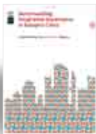
IZENBURUA: BENCHMARKING INTEGRATION GOVERNANCE IN EUROPE'S CITIES. LESSONS FROM THE INTI-CITIES PROJECT EGILEAK: CATSARAS, Z. ETA KIRCHBERGER, A. ARGITARATZEN DU: EUROCITIES ORRIALDEAK: 32 ARGITALPEN URTEA: 2009

hirien elkarteak, argitaratu berri duen liburuxka honek. Inticities izeneko proiektu baten ondorio den lan honetan, peer review edo parekoeen berrikusketaren metodologia aurkezten da eta tokian tokiko gizarteratze programen gestioa hobetzeko izan dezakeen erabilpena azaltzen zaigu, azalpen teorioak proiektuan parte hartu zuten hiriek izandako esperientziekin aberastuz, beti ere. Proiektuaren hastapenetan, hiri partaideek elkarren gizarteratze programak ebaluatu ahal izan zituzten, adierazle multzo bat garatu zen gizarteratzearen arloan praktika egokienak kontsideratzen diren oinarrituta. Adierazle horiek liburuxkaren bigarren partean daude jasota, euren gizarteratze politikak aztertu eta hobetu nahi dituzten udalen esku. Azkenik, liburuxkaren hirugarren partean, kalitatezko gizarteratze programa batek izan behar dituen premiazko zortzi ezaugarriak deskribatzen dira eta ezaugarri bakoitza praktikan nola jarri adierazten. Elkarrekin, liburuxka honen hiru parteei tresna berritzaile eta sendoa eskaintzen diete udal administrazioetan etorkinen gizarteratzea bultzatzeko programen ardura duten pertsonen.