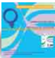
TÍTULO: HERRAMIENTAS PARA EL AUTODIAGNÓSTICO Y LA ELABORACIÓN DE PLANES DE IGUALDAD EN AYUNTAMIENTOS. PROYECTO DE ACCIÓN 3: TRANSFERENCIAS DE PROTOCOLOS DE IMPLANTACIÓN DE PLANES DE IGUALDAD DE OPORTUNIDADES Y CONCILIACIÓN EDITA: FUNDACIÓN MUJERES PÁGINAS: 107; 72; 44; 44; 35 AÑO DE PUBLICACIÓN: 2007