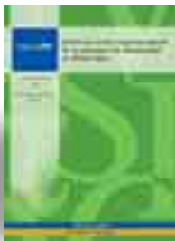
BAREA TEJEIRO, J. (DIR.) Y MONZÓN CAMPOS, J. L. (COORD.) ECONOMÍA SOCIAL E INSERCIÓN LABORAL DE LAS PERSONAS CON DISCAPACIDAD EN EL PAÍS VASCO. BILBAO, FUNDACIÓN BBVA, 182 PÁGINAS, 2008.

Un estudio realizado por EHLABE en colaboración con la Fundación BBVA evalúa el papel de la economía social en la inserción laboral de las personas con discapacidad. Tras reconocer la aportación determinante de los centros especiales de empleo en esta labor, el estudio aboga por combinar en un mismo modelo las fórmulas de empleo protegido y de empleo con apoyo en el mercado ordinario.