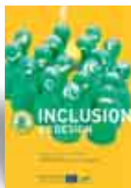
TÍTULO: INCLUSION BY DESIGN. A PRACTICAL BOOKLET TO HELP NGO'S APPROACH INCLUSION IN A STRATEGIC WAY AUTORES: HENDRIKS, A. (COORD.) EDITA: YOUTH INCLUSION RESOURCE CENTRE PÁGINAS: 116 AÑO DE PUBLICACIÓN: 2008

la sociedad durante la etapa adulta. Parte de esos procesos de aprendizaje se realizan en centros escolares, pero otra buena parte tienen lugar en entornos informales. Por ello, las intervenciones realizadas desde la pedagogía social y dirigidas a adolescentes y jóvenes pueden contribuir a una transición exitosa hacia el mundo adulto –en términos de acceso al mercado laboral o a la vivienda, por ejemplo– de quienes emprenden ese camino a partir de posiciones poco favorables. Las organizaciones juveniles que no sepan bien cómo afrontar este reto encontrarán en esta guía orientaciones básicas para abordar la inclusión social desde una perspectiva estratégica. Al estar concebido para entidades con poca experiencia en gestión, el primer objetivo del documento es determinar si aquéllas necesitan una estrategia inclusiva, lo cual se averigua mediante un pequeño test. A continuación, y siempre con un lenguaje sencillo, se define el concepto de estrategia, se estudian las ventajas y desventajas de contar con un instrumento de estas características y se explican las cuatro fases de que consta una estrategia tipo (análisis, planificación, implementación y evaluación). El apartado final de la guía recoge algunas herramientas prácticas que pueden ayudar a completar esas fases, y ofrece también una selección de libros, artículos y recursos de Internet para las entidades que quieran continuar formándose en este campo.